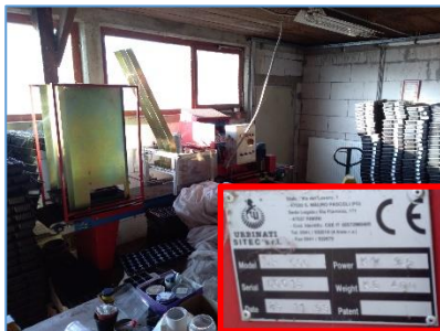
Robot za presaditev sadik, letnik 1998