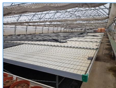
Poplavne / potopne mize plastenjaki