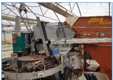
Avtomatski polnilnik zemlje, letnik 1998