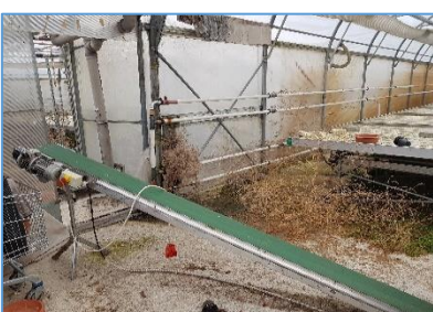
Transportni trak iz AL NTA 600, letnik 2005