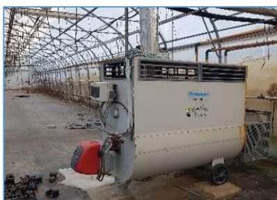
Agregat grelni z goril. 18,19