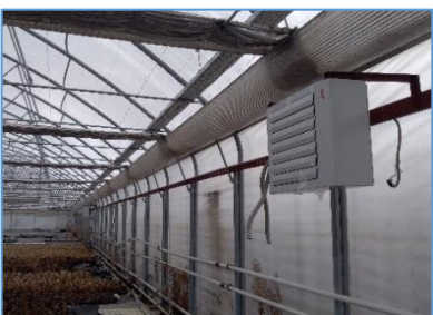
Toplotni izmenjevalci 8 kos, novi 2018