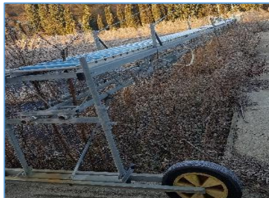
Zalivalna rampa na prostem, letnik 2007